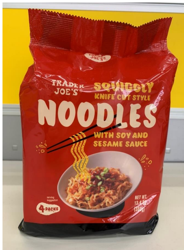
關廟麻油蔥醬乾麵